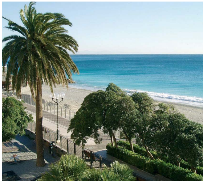
Un'immagine di una palma, vegetazione mediterranea ed il mare.

L'intervento prevede anche 22 nuove abitazioni che verranno acquistate dagli spotornesi che avranno diritto a € 2900,00 a mq con relativo box pertinenziale; previste anche 6 abitazioni in affitto a canone agevolato per almeno 16 anni a € 5,50 a mq.